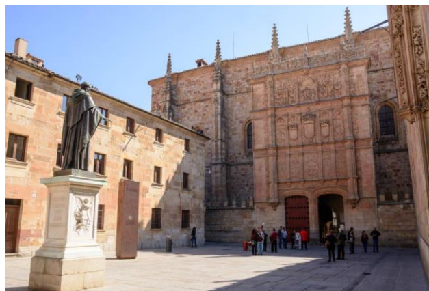
Fachada de la Universidad de Salamanca.